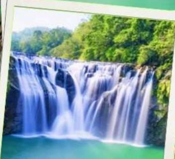
น้ำตกสี่แผ่นดิน