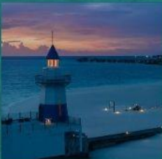
Light House Restaurant