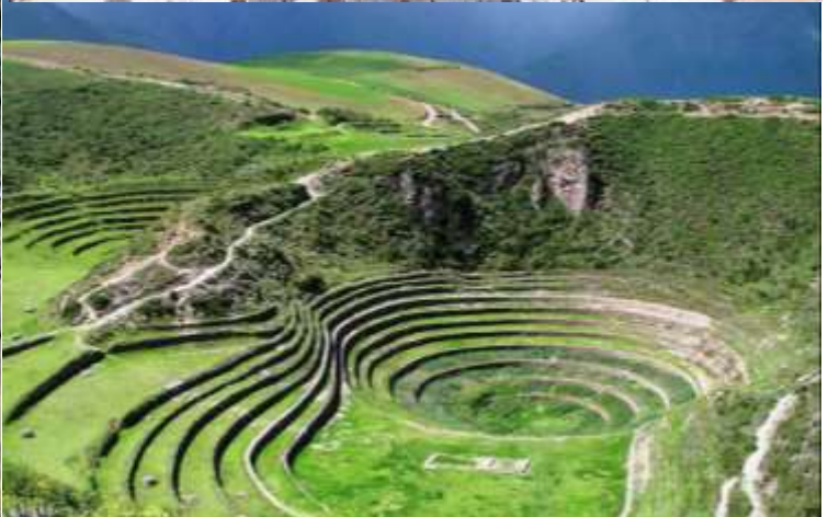
บ่าย นำท่านเดินทางสู่ มาราซ (Maras) แหล่งผลิตเกลือที่คุณภาพดีที่สุดในโลก ที่มีมาตั้งแต่สมัยอินคา แนวนาชั้นบันไดที่เรียงอยู่ตามลำดับความสูงของภูเขา จากนั้นเดินทางสู่ โมเรย์ (Moray) นาชั้นบนโดวงกลมขนาดใหญ่หลายวงรูปร่างแปลกตาที่ชาวอินคาทำไว้เพื่อทดลองปลูกพืชพันธุ์ต่างๆ จากจุดนี้สามารถมองเห็น หมู่บ้านอูรัมบัмба (Urubamba) ได้อีกด้วย ได้เวลาเดินทางกลับสู่เมือง เมืองคัสโก (Cusco) เมืองหลวงของอาณาจักรอินคา ที่แพร่ขยายอำนาจจนกินพื้นที่ 1 ใน 3 ของอเมริกาใต้ ตั้งอยู่เหนือระดับน้ำทะเลถึง 3,400 เมตร และเป็นแหล่งอารยธรรมยุคก่อนประวัติศาสตร์ที่ลึกลับน่าทึ่ง เป็นชุมชนเก่าแก่ของจักรวรรดิอินคาอันรุ่งเรือง ซึ่งยังคงทิ้งร่องรอยความเจริญไว้ให้เห็นเป็นซากปรักหักพังโบราณและโบราณวัตถุต่างๆ เย็น ที่พักรับประทานอาหารค่ำ ณ Tunupa Cusco Novotel Hotel Cusco หรือเทียบเท่า