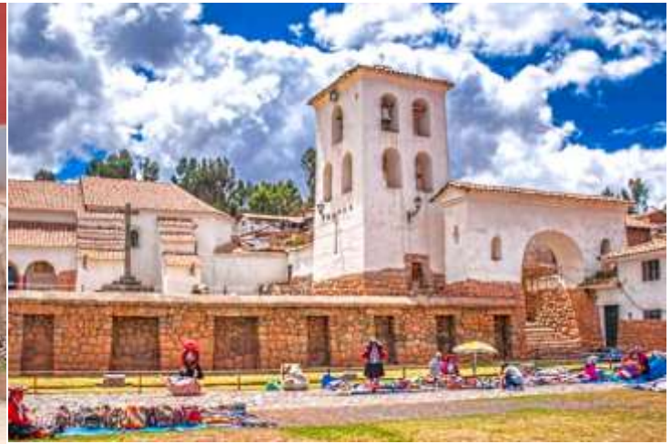
เที่ยง บริการอาหารกลางวัน ณ ภัตตาคาร Hanka Restaurant