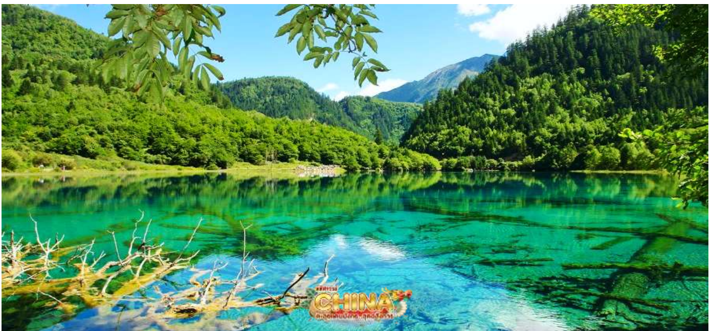
สถานที่ท่องเที่ยวที่อยู่ในอุทยานแห่งชาติจิวจ้ายโกว

ความสวยงามของภูเขา ลำธาร น้ำตก และทะเลสาบ ตั้งอยู่สูงกว่าระดับน้ำทะเลถึง 2,500 เมตร ภายในอาณาบริเวณอุทยานจิวจ้ายโกวประกอบด้วยภูเขาและหุบเขาอันสลับซับซ้อน เนื่องจากพื้นที่ส่วนใหญ่มีระดับพื้นดินที่ลดหลั่นจึงทำให้เกิดแอ่งน้ำน้อยใหญ่มากมาย ทั้งกลุ่มน้ำตกใหญ่น้อยและแม่น้ำ ซึ่งไหลมาจากหุบเขารวม 5 สาย ในยามฤดูใบไม้เปลี่ยนสีนั้น สีสนของ ทะเลสาบแห่งนี้จะเต็มไปด้วย สีแดง สีส้ม สีเหลือง ของใบไม้ที่ปลิดปลิวร่วงหล่นลงไป ในทะเลสาบ หากเป็นช่วงฤดูหนาวก็จะถูกปกคลุมไปด้วยหิมะ บรรยากาศที่สวยงามไปในอีกรูปแบบหนึ่ง จนได้รับฉายาว่า “ดินแดนแห่งเทพนิยาย”