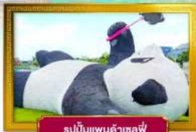
รูปปั้นแพนด้าเซฟี่