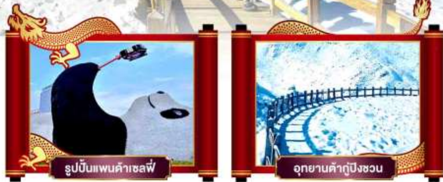
รูปปั้นแพนด้าเซลฟี่