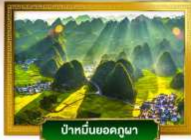
ป่าหมื่นยอดกฤษณา