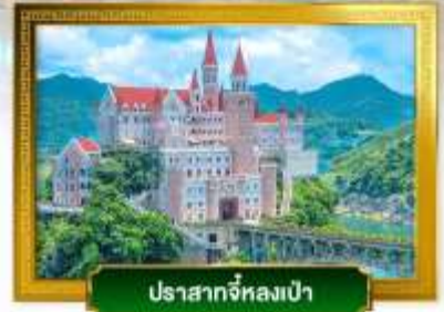
ปราสาทจีหลงเป่า