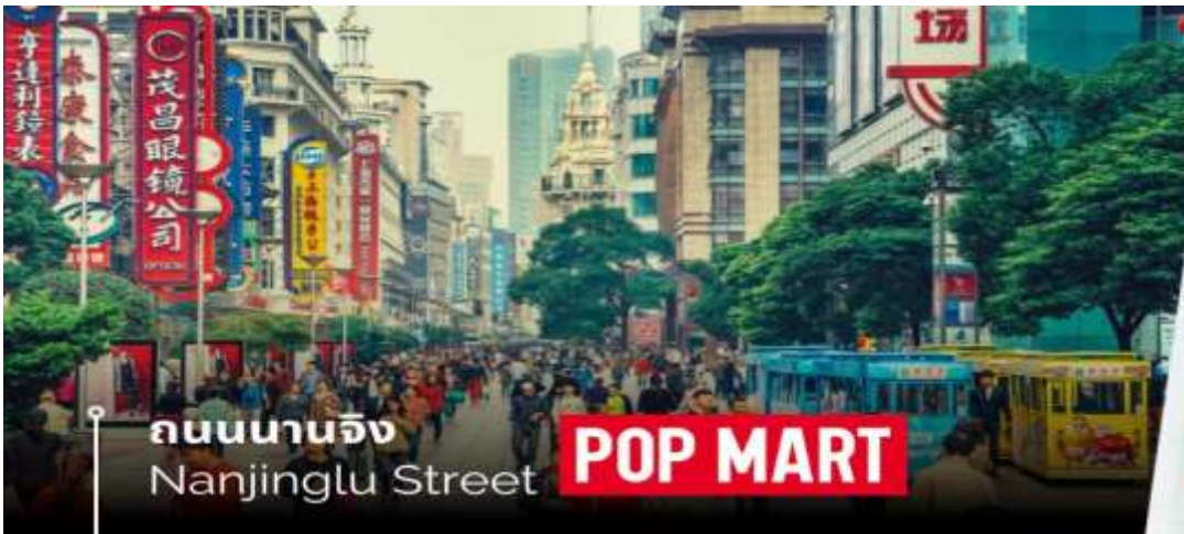
ถนนนานจิง Nanjinglu Street

จากนั้นนำท่านช้อปปิ้งย่าน ถนนนานจิง Nanjinglu Street ศูนย์กลางสำหรับการช้อปปิ้งที่คึกคักมากที่สุดของนครเซี่ยงไฮ้ รวมทั้งห้างสรรพสินค้าใหญ่ชื่อดังกว่า 10 แห่ง และช้อปปิ้ง ร้าน POP MART สุดฮิตในขณะนี้