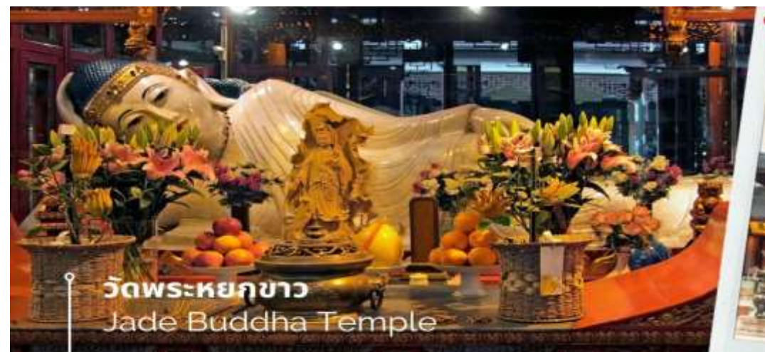
วัดพระหยกขาว Jade Buddha Temple

นำท่านชม วัดพระหยกขาว Jade Buddha Temple เป็นวัดที่มีชื่อเสียงมากที่สุดในเมืองเซี่ยงไฮ้ ซึ่งเป็นที่รู้จักจากพระพุทธรูปสององค์ที่สร้างขึ้นจากหยกทั้งแท่ง องค์พระพุทธรูปปางนั่งมีความสูง 190 เซนติเมตร และ หุ้มด้วยเพชรพลอย หิน มโนรา และ มรกต และองค์พระพุทธรูปปางไสยาสน์ มีความยาว 96 เซนติเมตร นอนเอียงด้านขวาและหนุนพระเศียรด้วยพระหัตถ์ขวา ถือเป็นวัดที่มีทั้งชาวจีนและนักท่องเที่ยวเดินทางมาสักการะบูชาตลอดทั้งวัน