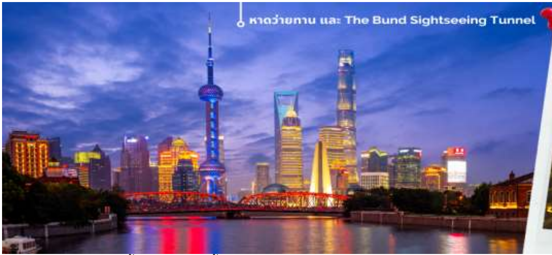
ทิวทัศน์ยามค่ำคืน และ The Bund Sightseeing Tunnel