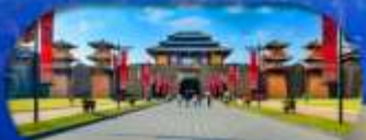
Hengdian World Studios โรงละครจำลองที่ใหญ่ที่สุดในโลก

เชียงใหม่ ทางใจ หึงเตียน ล่องเรือทะเลสาบซีหู