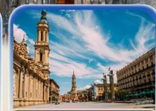
จัตุรัสพลาซ่า เดล ฟาร์