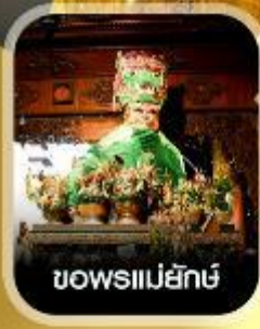
ขอพรแม่ยี่กั้ง