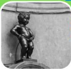
โรงแรมที่พัก 4 ดาว