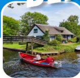
ท่องเที่ยวครบ ตลอดการเดินทาง