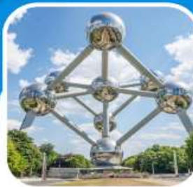
ช้อปปิ้ง มหานครปารีส

ล่องเรือชมแม่น้ำไรน์ เมือง เซนต์กอร์ - บ็อบพาร์ด ชมเมือง โคโลญจ์ มหาวิหารโคโลญจ์ เที่ยวเมือง กิ์รธุน ล่องเรือ ชมหมู่บ้าน ชมเมืองโวเลนดัม ซานสคัน อัมเตอร์ดัม เมืองหลวง เนเธอร์แลนด์ ล่องเรือหลังคากระฉก ชมสถาบันเพชร เที่ยว บรูจจ์ บรัสเซลส์ ชม อะตอมเมียม ชมเมืองเก่า เข้าสู่ปารีส เข้าพระราชวังแวร์ซายส์ อิสระช้อปปิ้ง ล่องเรือแม่น้ำแซนนต์