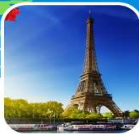
อาหารพิเศษเมนู พื้นเมือง