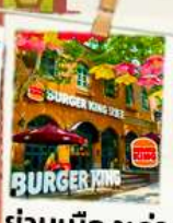
ย่านเมืองเก่า