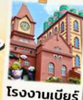
โรงงานเบียร์