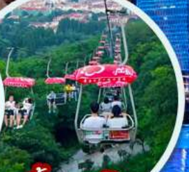
ขึ้นกระเช้าภูเขาไท่ผิง