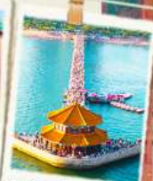
สะพานจันเจียว