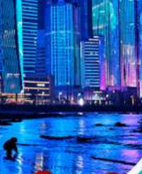
หาดไซเบอร์ Bathing Beach