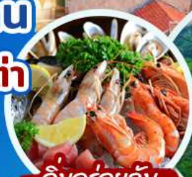
อิ่มอร่อยกับเมนูซีฟู้ด