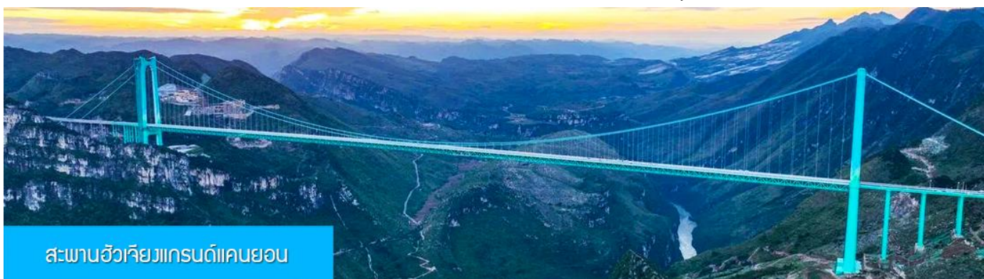
สะพานฮัวเจียงแกรนด์แคนยอน

พักที่ WINDHAM HOTEL โรงแรมระดับ 4 ดาวท้องถิ่นในเมืองอันซุ่น