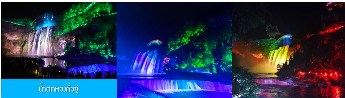
น้ำตกหวงกั๋วชู่

หลังอาหารนำท่านเที่ยวชม น้ำตกหวงกั๋วชู่ 黄果树瀑布 แหล่งท่องเที่ยวขึ้นชื่อระดับ 5A ที่ถือเป็นสัญลักษณ์ของมณฑลกุ้ยโจว เป็นหมู่ น้ำตกที่ประกอบด้วยน้ำตกน้อยใหญ่กว่าสิบแห่ง โดยมีน้ำตกหวงกั๋วชู่เป็นน้ำตกขนาดใหญ่ที่มีความสูง 74 เมตร กว้าง 81 เมตร เป็นน้ำตกหลักของอุทยาน ชมความสวยงามของน้ำตกที่ประดับด้วยแสงสีและเลเซอร์ยามค่ำคืน ที่แต่งแต้มความมหัศจรรย์แก่อุทยานแห่งนี้ (ค่าทัวร์รวมค่ารถรับส่ง รวมค่าบันไดเลื่อนขาลง และขาขึ้นภายในอุทยาน)