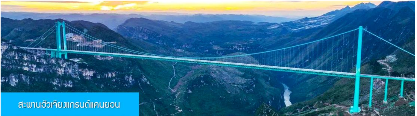
สะพานฮัวเจียงแกรนด์แคนยอน

รับประทานอาหารเช้า ณ ภัตตาคาร (มื้อที่ 7)