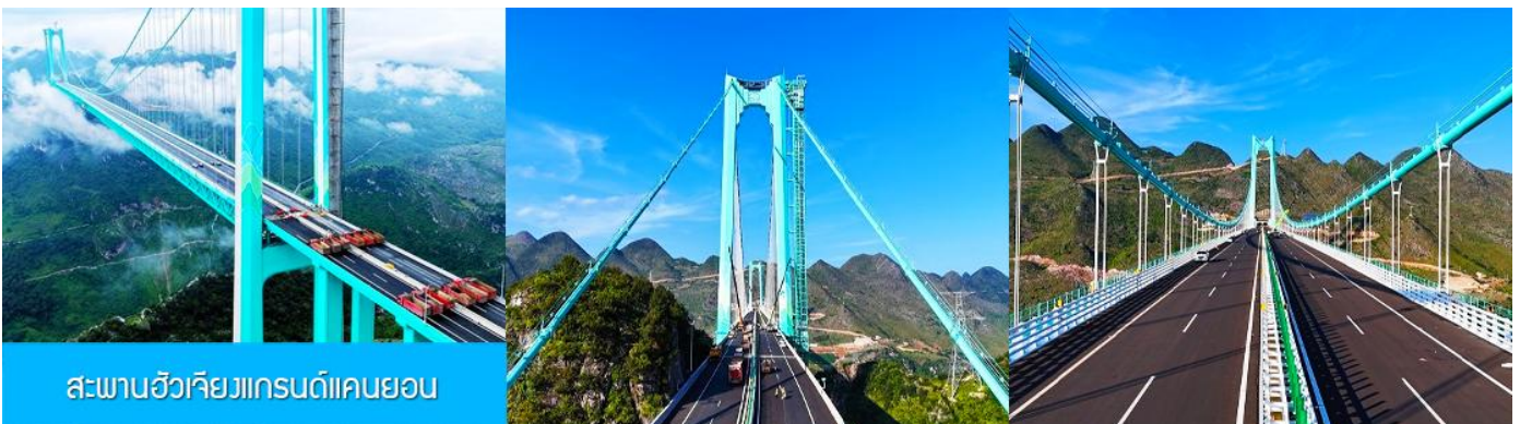
สะพานฮัวเจียงแกรนด์แคนยอน