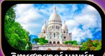
วิหารสกรเทอร์ มงมาร์ต