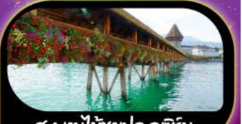
สะพานไม้ชาเปล คุชชิน