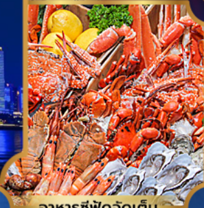
อาหารซีฟู้ดจัดเต็ม

บุฟเฟ่ต์เบียร์ไม่อื่น + ซีฟู้ด + บิงย่างเกาหลี