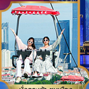
นั่งกระเช้า ชมเมือง