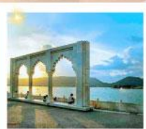
Ana Sagar Lake