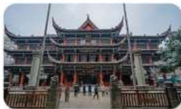
วัดเหวินซู