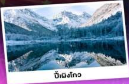
บี้ฝิงโกว

เทือกเขาแอลป์เมืองจีน "ภูเขาซีครุณี" ชมความสวยงามของอุทยานบี้ฝิงโกว