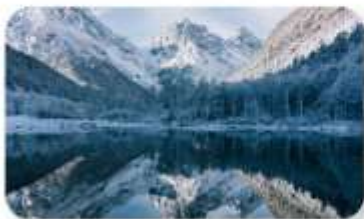
ปี้ฝิงโกว