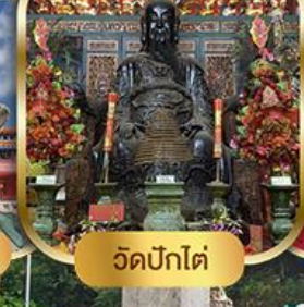
วัดปึกใต้