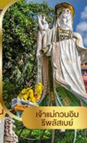
เจ้าแม่กวนอิม ริวสิสเมซ