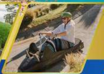
เล่นลู่ ที่ควีนส์ทาวน์

AUCKLAND / ROTORUA / CHRISTCHURCH FOX GLACIER / FRANZ JOSEF / QUEENSTOWN