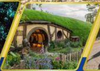
หมู่บ้านฮอบบิต