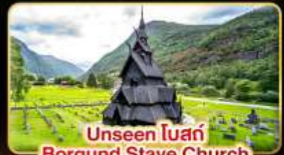
Unseen โบสถ์ Borgund Stave Church