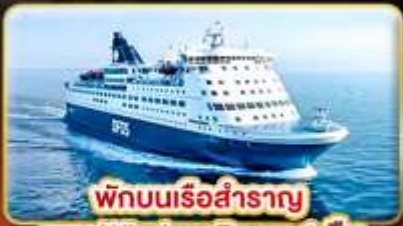
พักผ่อนเรือสำราญ แบบ Window Room 1 คืน

สัมผัสความเป็นที่สดุของ สแกนดิเนเวีย ให้ท่านได้พักผ่อนแบบ SLOW LIFE