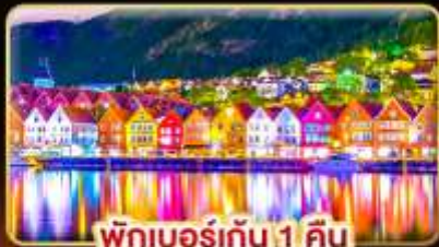
พักเบอร์เกน 1 คืน