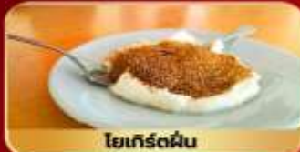
โยเกิร์ตผืน