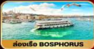
ล่องเรือ BOSPHORUS