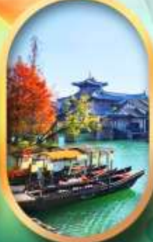
เมืองโบราณผู้หยวน