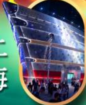
เรือคองคอลลี