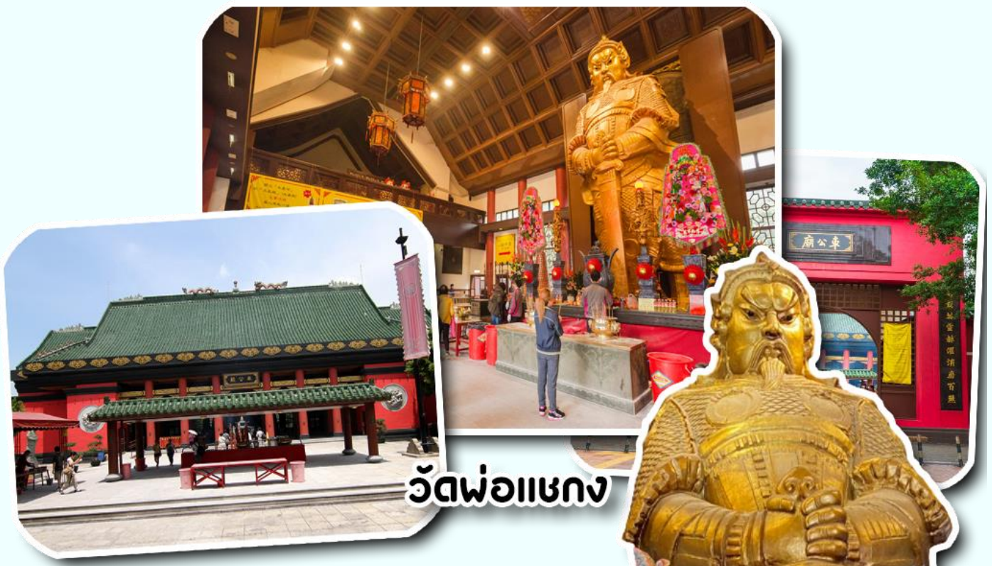
วัดพ่อแชกง

จากนั้นนำท่านเดินทางสู่ วัดแชกง วัดที่ชาวฮ่องกงให้ความเลื่อมใสศรัทธามาเนิ่นนาน สร้างขึ้นเพื่อระลึกถึงตำนานนักรบแห่งราชวงศ์ซ่ง เทพเจ้าแชกง แม่ทัพปราบศึกที่กล้าหาญ ในกองทัพของท่านยามที่ออกรบเพื่อต้านข้าศึกศัตรูทุกทิศทาง ทุกๆครั้งท่านจะใช้สัญลักษณ์รูปกังหัน 4 ใบพัด ติดไว้ด้านหน้ารถศึกลำขบวนในกองทัพของท่าน ซึ่งท่านมีความเชื่อว่าเมื่อพกพาสัญลักษณ์รูปกังหันนี้ไป ณ ที่ใดๆ กังหันนี้จะช่วยเสริมสิริมงคล นำพาแต่ความโชคดี มีอำนาจเข้มแข็งเสริมกำลังใจให้แก่กองทัพของท่าน ชื่อเสียงในการนำทัพสู้ศึกของท่านจึงเป็นตำนานมาจนทุกวันนี้