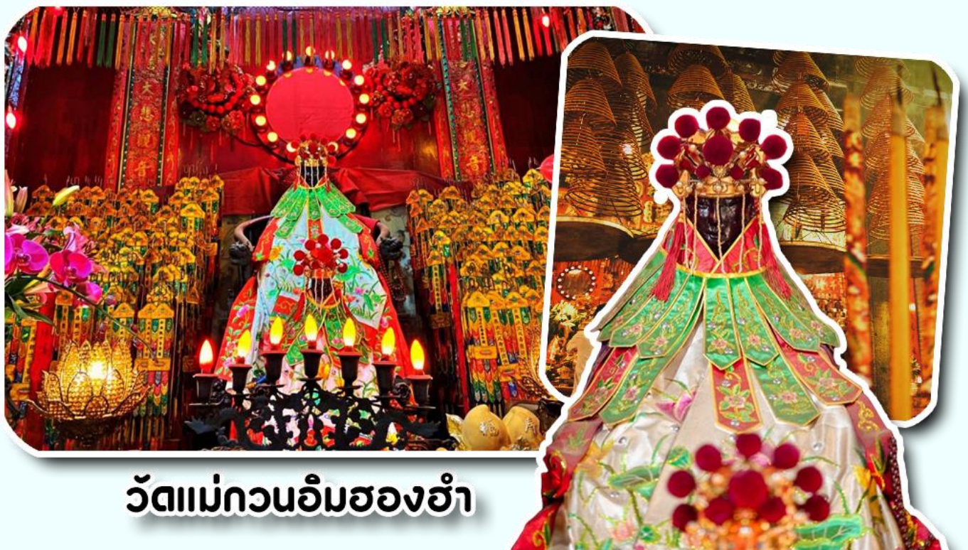
วัดแม่กวนอิมสองฮ่ำ

จากนั้นพาท่านเข้าไปไหว้ขอพร วัดแม่กวนอิมสองฮ่ำ วัดเก่าแก่ของฮ่องกงสร้างตั้งแต่ปี ค.ศ .1873 เป็นวัดขนาดเล็กที่มีชาวฮ่องกงศรัทธา นับถือกันเป็นอย่างมากวัดแห่งนี้เป็นที่ประดิษฐาน องค์เจ้าแม่กวนอิมสองฮ่ำ ที่มีชื่อเสียงเรื่องการให้กู้ยืมเงินเชื่อกันว่าท่านช่วยพลิกฟื้นเศรษฐกิจของชาวฮ่องกง ผู้คนจึงนิยมมาเยี่ยมเงินทำธุรกิจจนสำเร็จ ร่ำรวย รุ่งเรืองโดยให้ท่านอธิษฐานขอพรต่อหน้า เจ้าแม่กวนอิมสองฮ่ำพร้อมกับระบุวันเวลาในการขอพรด้วย จากนั้นนำธูปธูปตามฐานะและศรัทธาที่เราจะนำเป็นสื่อในการขอพร เขียนจำนวนเงินที่ต้องการลงไปด้วย ใส่สกุลเงินยิ่งดีใหญ่ แล้วนำเงินใส่ในซองแดง ควรเตรียมซองแดงไปเอง นำซองแดงไปวนรอบกระถางธูป วนขวาจำนวน 3 ครั้ง แล้วเก็บซองแดงในกระเป๋าสตางค์ เป็นเงินขวัญถุง ถ้าประสบความสำเร็จตามที่มุ่งหวัง ให้นำเงินในซองแดงทำบุญหยอดตู้ที่วัดแห่งนี้ในโอกาสต่อไป