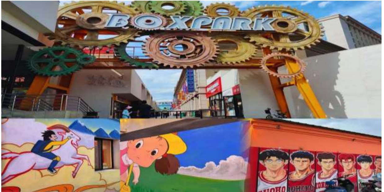
อิสระอาหารค่ำตามอัยาศัย

จากนั้นนำท่านเดินทางไปยังถนนคนเดินคังปาสือ (Kangbashi Walking Street) ถนนสายวัฒนธรรมผสมผสานมนต์เสน่ห์ของวัฒนธรรมมองโก บริเวรรอบๆ มีอาคารบ้านเรือน สถาปัตยกรรมสมัยราชวงศ์หมิงและชิง เป็นศูนย์รวมของความบันเทิง ร้านค้าและร้านอาหาร แหล่งรวมอาหารหลากหลายประเภท อาหารพื้นเมืองมองโก เนื้อแกะย่าง, ซีสมม, อาหารเสฉวน,อาหารหูหนาน ฯลฯ