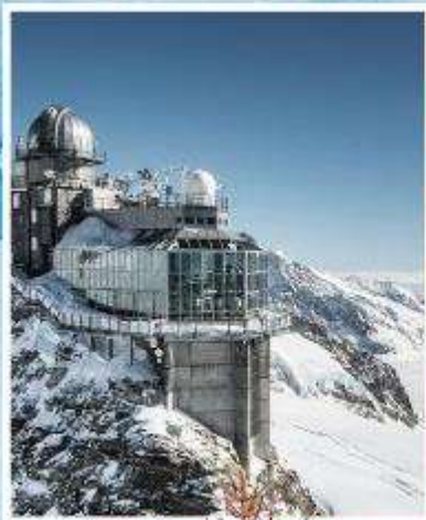
JUNGFRAUJOCH "Top of Europe"