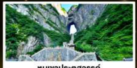
ทิวเขาประตูสวรรค์