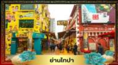
ย่านโกปา