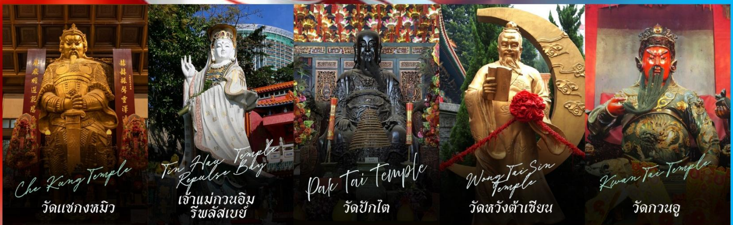
Che Kung Temple วัดแชกงทมิว

รายการทัวร์ข้างต้นอาจมีการปรับเปลี่ยนเพื่อความเหมาะสม