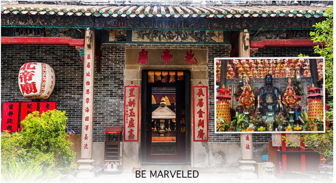
BE MARVELED วัดปักไต้

แห่งท้องทะเล ในลัทธิเต๋า และชาวฮ่องกงเชื่อกันว่าผู้ใดที่เกิดปีชง หากมาทำการแก้ดวงชะตาแก้ชงประจำปีที่วัดนี้ จะทำให้ร้าย กลายเป็นดีได้ และที่วัดยังมี “เทพเจ้าเปลี่ยนใจ” ที่นิยมมาขอพรให้เรื่องที่ไม่ดี กลายเป็นเรื่องดีหรือ คนที่เป็นศัตรูของเราเปลี่ยนใจมาเป็นมิตร เป็นที่นิยมอย่างมากของชาวท้องถิ่นฮ่องกงมากราบไหว้ขอพรกันที่วัดนี้