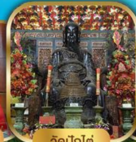
วัดปึกใต้