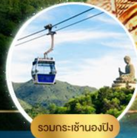
รวมกระเช้าฮ่องกง