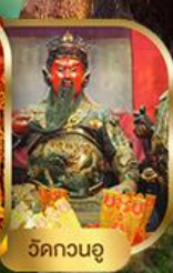
วัดกวนอู