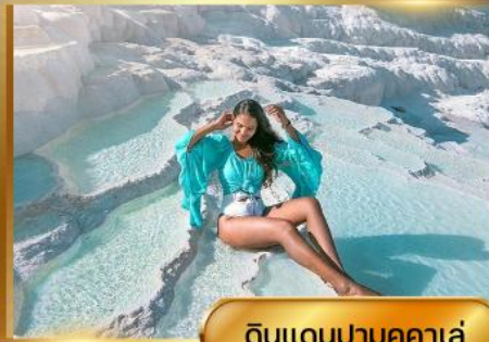
ดินแดนปามุคคาเล่