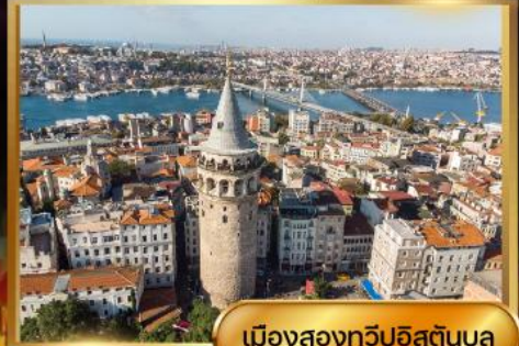
เมืองสองทวีปอิสตันบูล