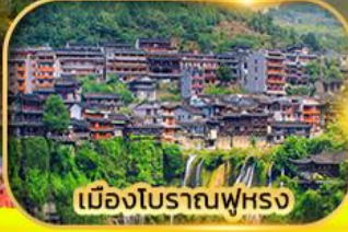
เมืองโบราณฟูหยง