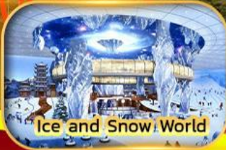
Ice and Snow World