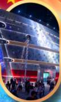
เรือเดอะหลุยส์