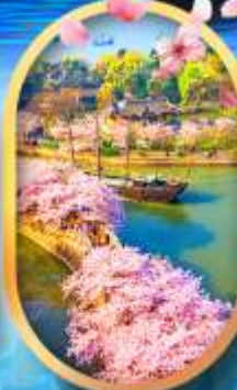
ล่องเรือสวนหยวนโกวจู