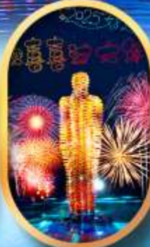
หมู่บ้านเนียนฮิวาน