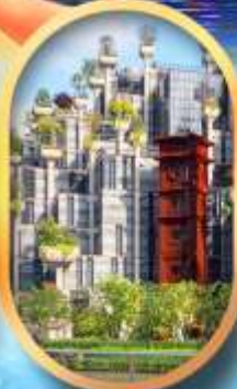
อาคารพินตันโม