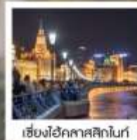
เซี่ยงไฮ้ คคลาสสิก ไทท์