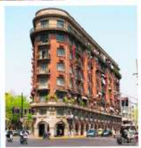
ถนนอู๋คิง