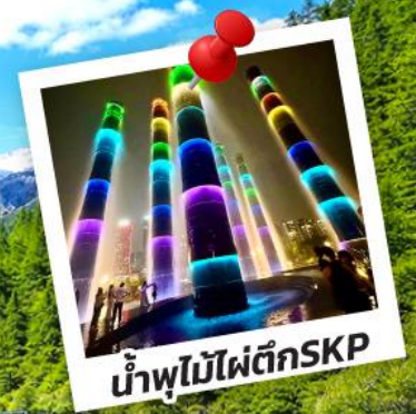
น้ำพุไม้ไฟตึกSKP

อุทยานปี้ฝิงโกว อุทยานจิวจ้ายโกว 6วัน 5คืน