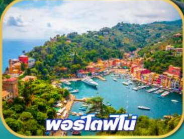
พอร์โตฟิโน