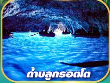
ถ้ำลุกรอดโก