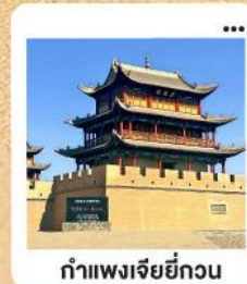
กำแพงเจียยี่กวน