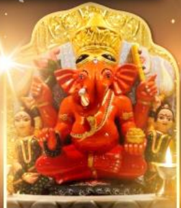
องค์สิทธีวินายัก