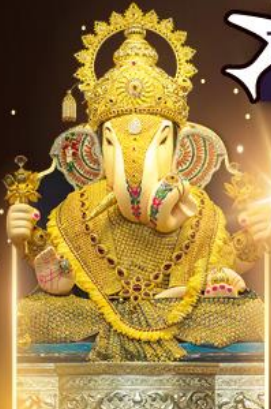
องค์ดีกษุท์เศษฐ์