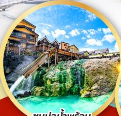
ชมบ่อน้ำพุร้อน ยูบาคาเกะ