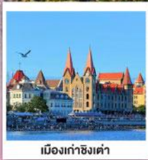
เมืองท่าชิงเต่า

ละมุนกรุ่นกลิ่นสตรอว์เบอร์รี่ เย็นใจ เวียงไค่ จี๋หนาน