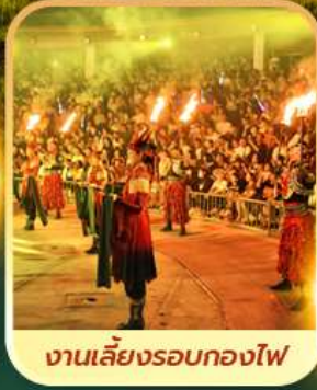
งานเลี้ยงรอบกองไฟ