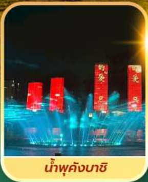
น้ำพุคังบาซี