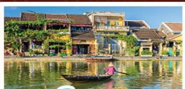
เมืองโบราณเฮอฮอัน

! พักบนเขานาฮิลล์ 1 คืน ! สัมผัสอากาศเย็นตลอดปี สตรีตฟรังเศสสุดคลาสสิก - นั่งกระเช้ายาวที่สุด สู่มานาฮิลล์ สนุกสุดมันส์ไปกับสวนสนุก The Fantasy Park นมัสการเจ้าแม่กวนอิมองค์ใหญ่ที่สุดของเมืองดานัง - เช็กอินเมืองมรดกโลกฮอยอัน - สนุกสนานไปกับกิจกรรม!!นั่งเรือกระดิง หมู่บ้านกัมทาน เช็กอินร้านกาแฟ SON TRA MARINA CAFE - ไม่หลงร้านช้อปปิ้ง - อิ่มอร่อยกับบุฟเฟ่ต์นานาชาติ , หม้อไฟซีฟู้ด