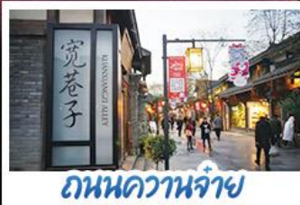
ถนนควานจ้าย