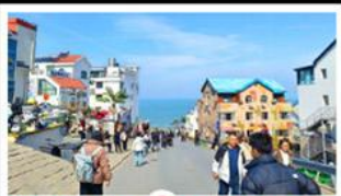
ถนนคอปเปลิ่งหมายเลข 8

สัมผัสความยิ่งใหญ่ของ 4 เมืองสำคัญ ชิงเต่า - เยียนโก - เฟิงไฮ่ - เว่ยไห่ ปาต้ากวน - โบสถ์คาทอลิก - ตึกเก่าริมหา