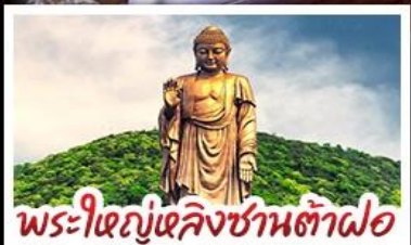
พระใหญ่เลิ่งยี่ซานต้าฝอ