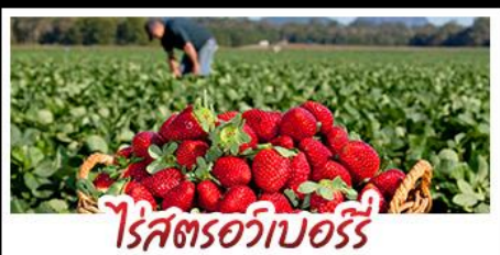
ไรศตรอบออร์รี่

คฤหาสน์เหวินเจิง - สวนชากรุงชิงเต่า ไรศตรอบออร์รี่ - โรงเบียร์ชิงเต่า