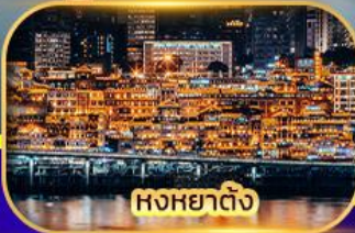
หงหยาดิง