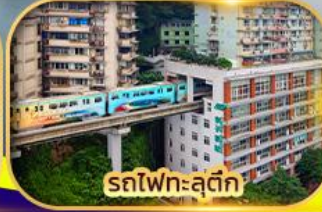
รถไฟฟ้าสุดึก