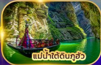
แม่น้ำใต้ดินกุ้ยโจว