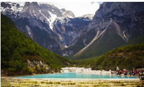
อุทยานไป๋สู่ยเหอ (หุบเขาพระจันทร์สีน้ำเงิน)

หมายเหตุ กรณีที่กระเช้าขึ้นภูเขาหิมะมังกรหยกปิดให้บริการ ด้วยเหตุที่สภาพอากาศไม่เอื้ออำนวย หรือเป็นการปิดเพื่อตรวจสอบสภาพและซ่อมแซมประจำปี ทางทัวร์ขอสงวนสิทธิ์ที่จะจัดโปรแกรมขึ้นกระเช้า ที่จุดชมวิวภูเขาหิมะมังกรหยก ณ สถานีกระเช้าหุยูนชานผิงแทน