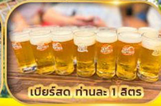
เบียร์สด ท่านละ 1 ลิตร