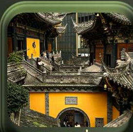
“ วัดหลิวอัน ”