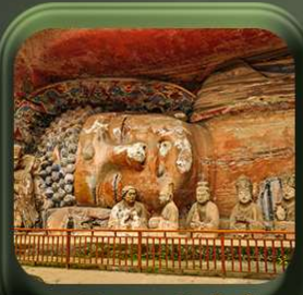
“ พาหินแกะสลักต้าจู้ ”

T2G-CKG26CZ Special of Chongqing...จงซิง ต้าจู้ อุ้หลง อุทยานหลุมฟ้า เขานางฟ้า 5D 3N (CZ)